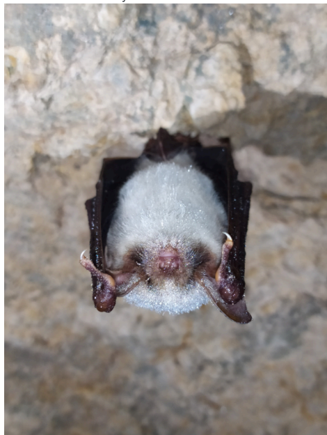
Grand Murin

Des rendez-vous à ne pas manquer pour le prochain week-end !