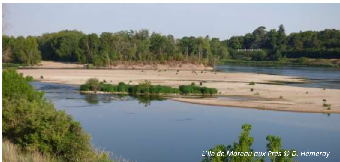
L'île de Mareau aux Prés

Soulignons également le retour des sternes sur l'île de Mareau (photo ci-dessous). Suite à la dévégétalisation de l'île en 2012, et profitant des niveaux exceptionnellement bas en 2015, dix couples de sternes naines se sont installés ; sept jeunes ont pris leur envol.