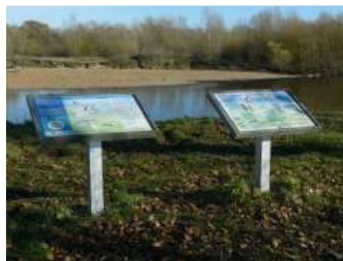
Rénovation des tables didactiques. A gauche , retrait des tables de Châtillon, le site étant complètement boisé. A droite , les nouvelles tables, en place à Beaulieu-sur-Loire.