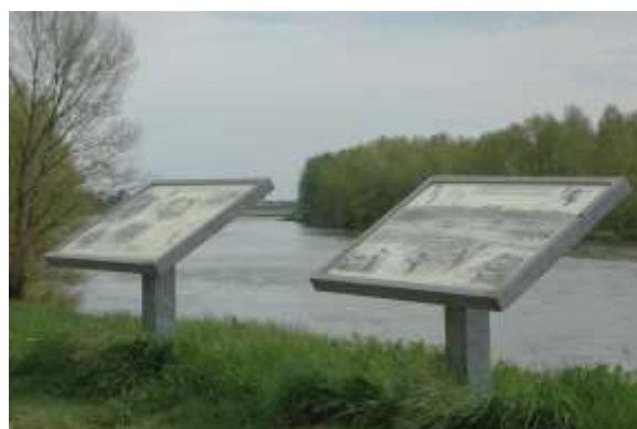
4 Anciennes tables didactiques. Les dernières ont été renouvelées ou déplacées en 2015

Depuis 2010, grâce aux financements du Plan Loire Grandeur Nature, les tables ont pu être progressivement renouvelées. Elles sont aujourd'hui pourvues d'illustrations en couleur.