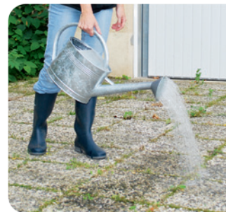
Le désherbage à l'eau bouillante : sûr et efficace

Désherber à l'eau bouillante, c'est très efficace, sûr et parfaitement adapté aux petites surfaces. Ne pas attendre d'être envahi et intervenir dès les premières pousses. Penser à récupérer l'eau de cuisson des légumes. Epandre l'eau bouillante avec une casserole ou un arrosoir galvanisé.