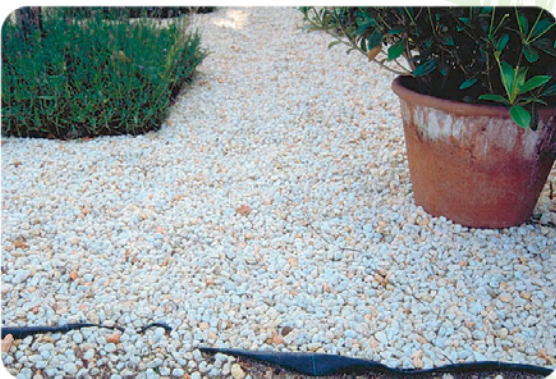
Géotextile sous les gravillons