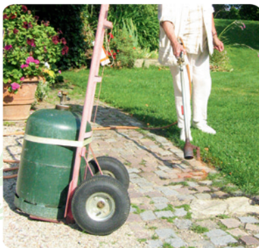
Désherbage au gaz