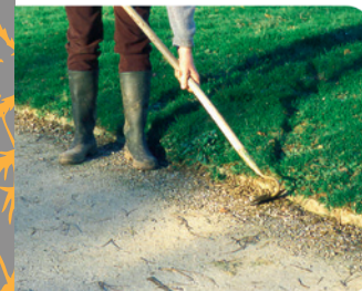
Binage des bordures d'allées

Quand c'est possible, les détacher avec un racloir (ou une binette à pousser), puis passer le balai brosse. Pour les plus tenaces, utiliser un karcher haute pression. En ultime recours, utiliser un anti-mousse à base de D-limonène à condition de se protéger (il est irritant pour la peau et les yeux).