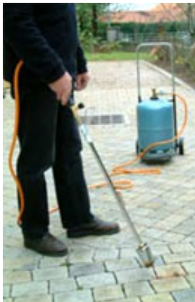
Désherbage thermique

Élimine les plantes en les brûlant : au contact de la chaleur, les tissus végétaux éclatent et dépérissent rapidement. Pour être efficace, il ne faut pas brûler la plante mais juste la chauffer. Pour bien désherber avec un désherbeur thermique , prévoyez de passer à plusieurs reprises, afin d'épuiser progressivement les plantes qui tentent de repartir après le passage précédent.