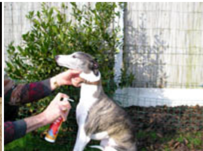
Traitement anti-puce naturel