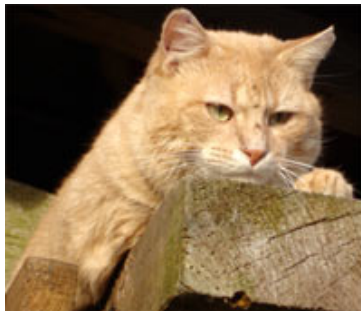
Un chat pour attraper les souris