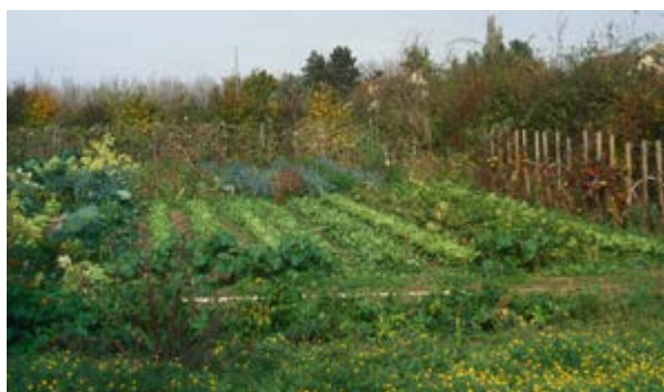
Soucis sauvages au premier plan

Les géraniums vivaces, le millepertuis , les pervenches , les gaillets ou encore les soucis occupent l'espace au sol et limitent le développement des herbes indésirables