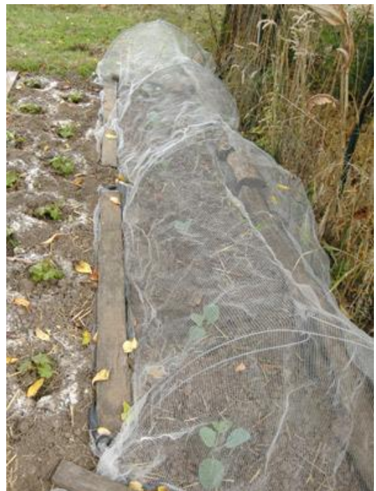
Filet à insectes sur semis