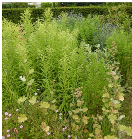
Plantes couvre -sol

Au pied des arbres et des haies, dans les massifs et au pied des murs, les plantes couvre-sol forment un tapis dense qui empêche les herbes indésirables de pousser.