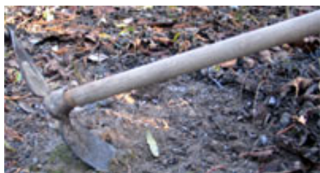
1 binage vaut toujours 2 arrosages

Élimine les plantes adventices et aère le sol. Dans un premier temps, avant les semis, il consistera à ameublir le sol à l'aide d'un outil de type grelinette ou une fourche écologique . Il sera suivi d'un émiettage des mottes, puis d'un léger ratissage. La fourche écologique permet également d'enfouir le compost et les engrais verts.