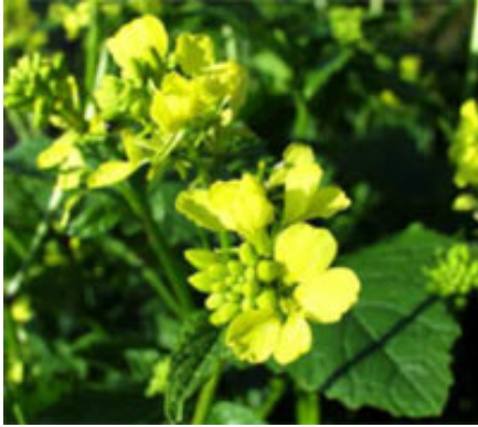
La moutarde, un engrais naturel !

Enfouis et intégrés au sol, ils enrichissent la terre du jardin. Ces plantes présentent le double avantage de :