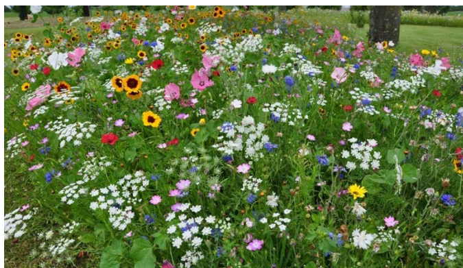
Prairie fleurie !