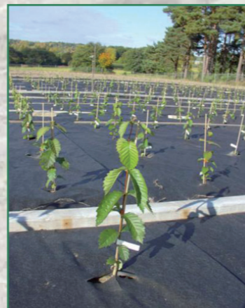
Plantation comparative d'Ormes lisses

En complément de la conservation de populations in situ (sur place), des chercheurs français et européens ont bouturé des Ormes lisses et réalisé des collections ex situ sous forme de haies basses ou de vergers. Ces collections sont utilisées pour des études génétiques ou pathologiques et peuvent également servir de sources de boutures ou de graines pour le reboisement.