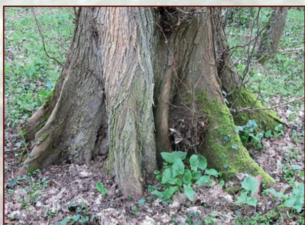
Les contreforts, présents chez les sujets âgés, permettent d'identifier à coup sûr l'Orme lisse