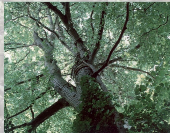
Ramure d'Orme lisse

D'avantage présent en Europe centrale, l'Orme lisse est un arbre peu fréquent et méconnu dans la vallée de la Loire, où l'on rencontre surtout l'Orme champêtre. A l'état naturel, on ne le trouve que dans les ripisylves (étroites forêts bordant les cours d'eau). Ce dépliant vous aidera à reconnaître cette espèce, à découvrir son habitat et à protéger ses populations naturelles menacées par une maladie (la graphiose), et la destruction des ripisylves.