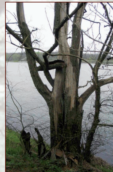
Orme lisse touché par la graphiose

morcelées ou de trop petite taille risquent de perdre une partie de leur diversité génétique à cause de l'insuffisance des échanges de pollen et du 'brassage génétique' entre arbres reproducteurs. Pourtant, cette diversité génétique est vitale pour la survie de l'espèce à long terme car elle conditionne sa capacité d'évolution. De même, chaque population doit trouver en son sein les gènes qui lui permettront de s'adapter, par la sélection naturelle au fil des générations, aux changements de son environnement (climat, maladies, ...).