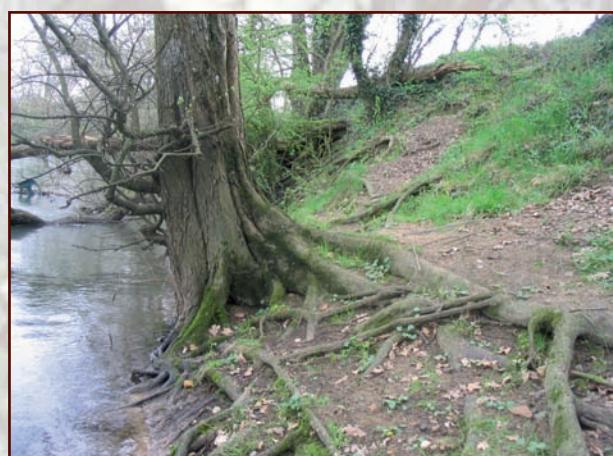
Enracinement puissant favorisant la stabilisation des berges