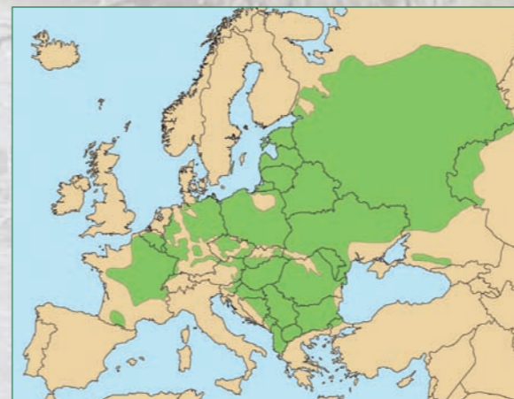
Répartition de l'Orme lisse (EUFORGEN)