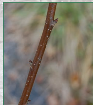
Jeune Orme lisse reconnaissable à son écorce de "noisetier"