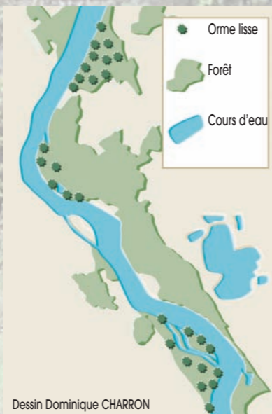
Dessin Dominique CHARRON Maintenir un corridor naturel entre deux populations

Il faut conserver précieusement les grandes populations capables de se reproduire naturellement par semis. La réserve naturelle du Val d'Allier, située près de Moulins, et celle de Saint-Mesmin, à l'aval d'Orléans se sont engagées, dans leurs plans de gestion respectifs, à mettre en œuvre des opérations de conservation et de suivi scientifique de cette espèce. On doit aussi protéger ou restaurer les corridors biologiques le long des cours d'eau qui limitent les effets néfastes du morcellement des populations.