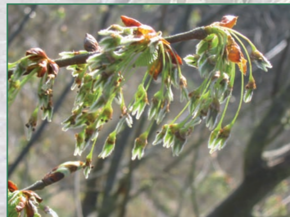
Fleurs de l'Orme lisse (avril)