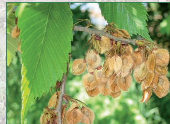
Fruits de l'Orme lisse (début mai)