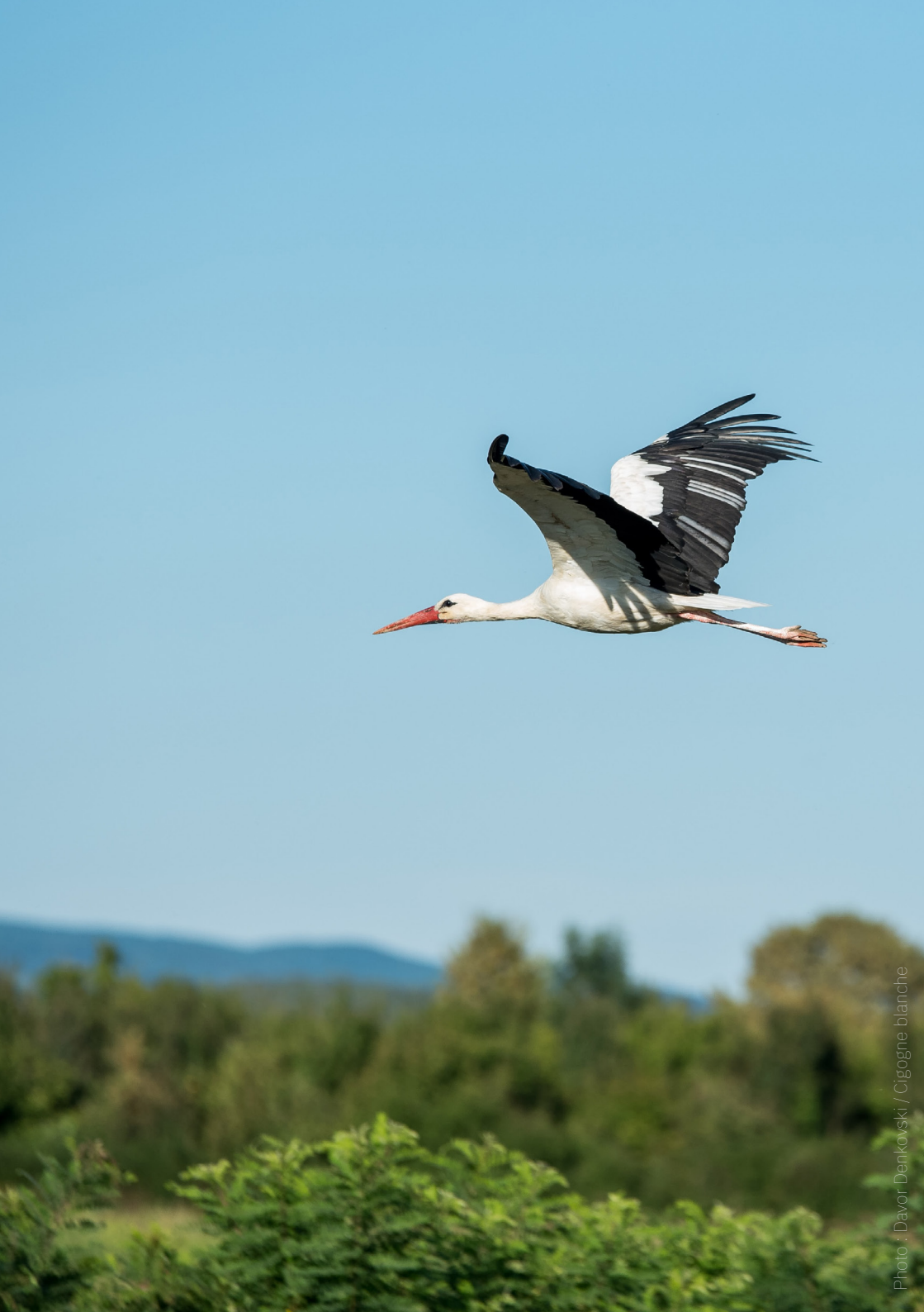
Cigogne blanche