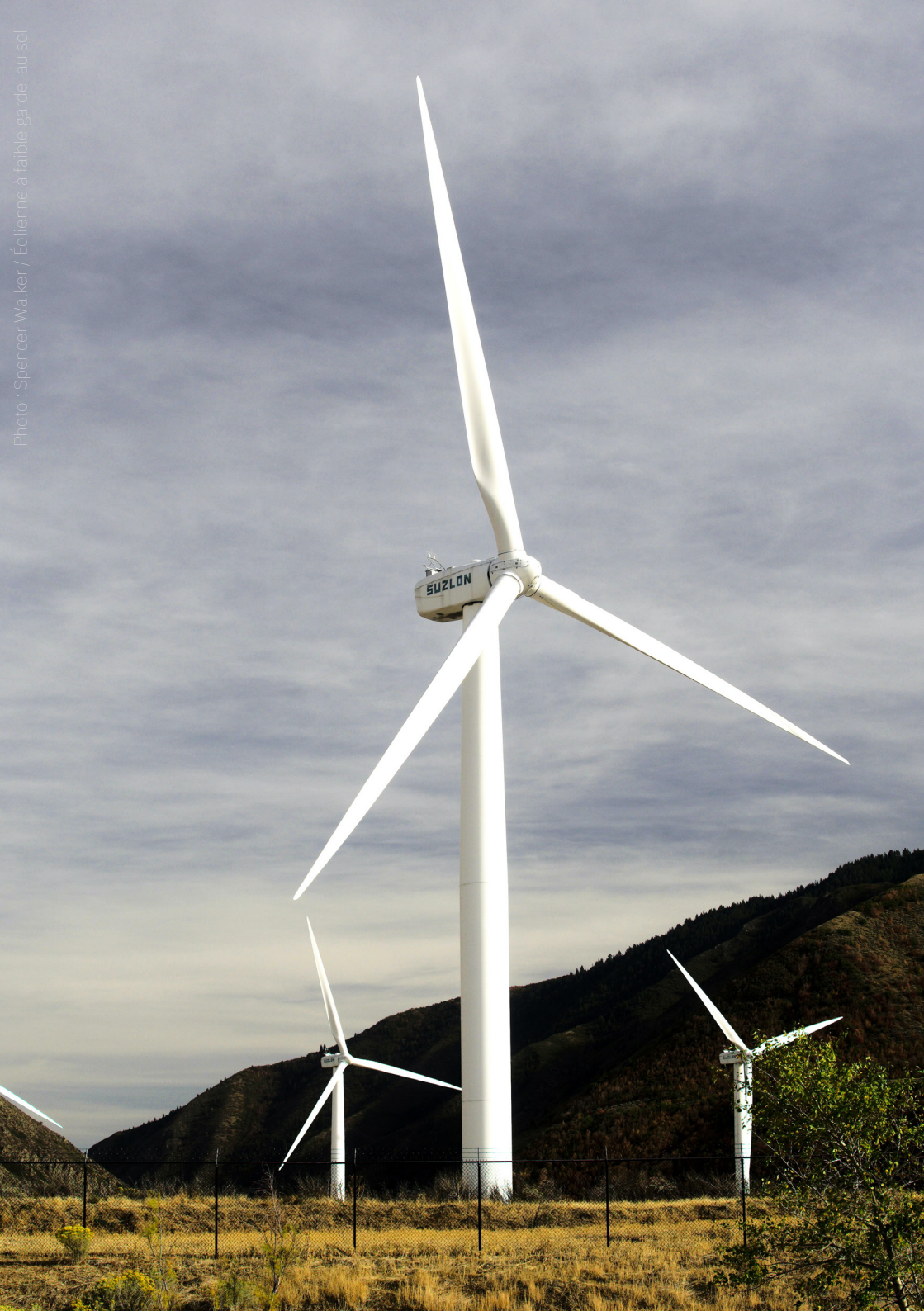
Éolienne à faible garde, au sol.