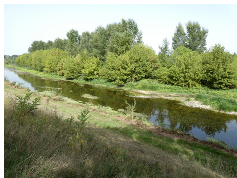
Point photo n°14-2023