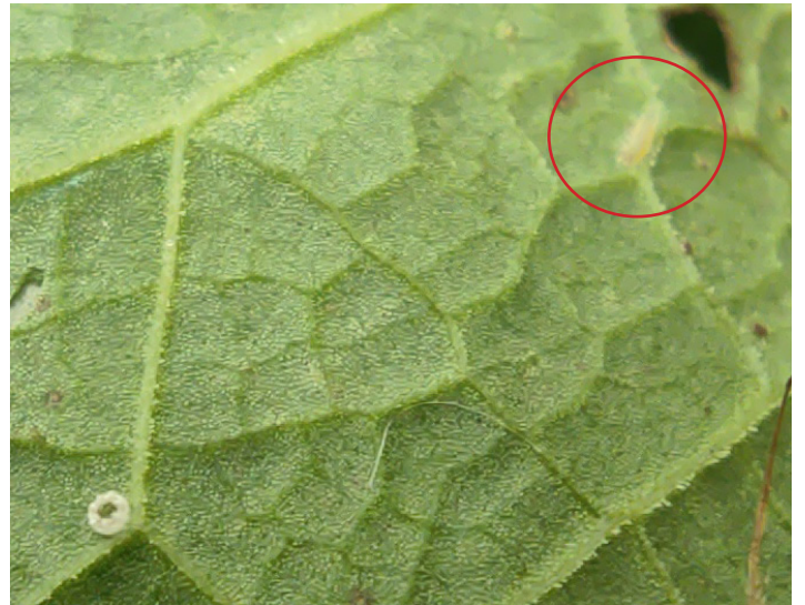
Œuf éclos de Cuivré des marais et chenille à droite sur une feuille d'Oseille.

Lors de cette campagne de terrain 2023, une seule station de Cuivré des marais a été observée (déjà connue en 2022 pour l'observation d'un imago) avec un œuf éclos et sa chenille. Cette donnée de ponte est importante car elle prouve que la prairie humide étudiée est bien fonctionnelle pour cette espèce.