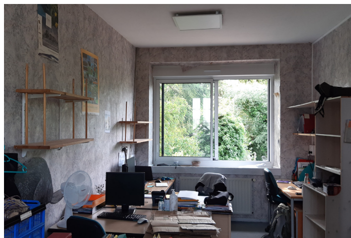
Bureau de la réserve naturelle - Avant travaux

Un grand merci à tous pour ce résultat très appréciable !