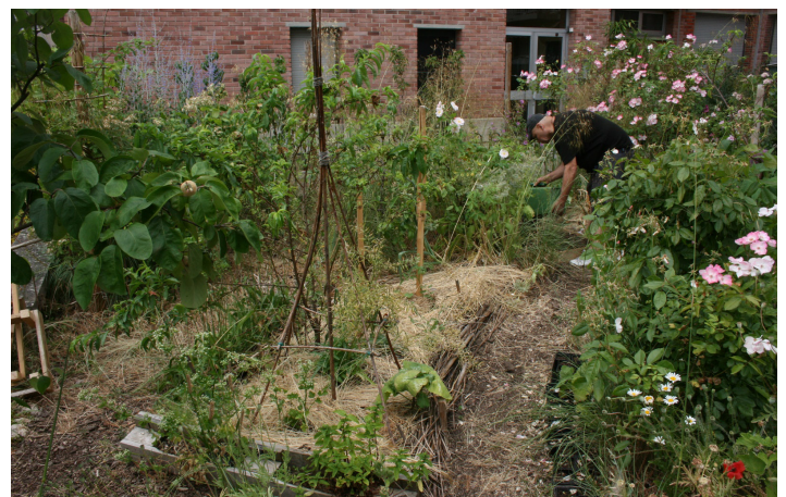
Jardinière des Chats Ferrés à Orléans

Un grand merci aux jardinier.e.s qui ont ouvert leurs portes au public et rendez-vous l'an prochain pour une nouvelle édition !