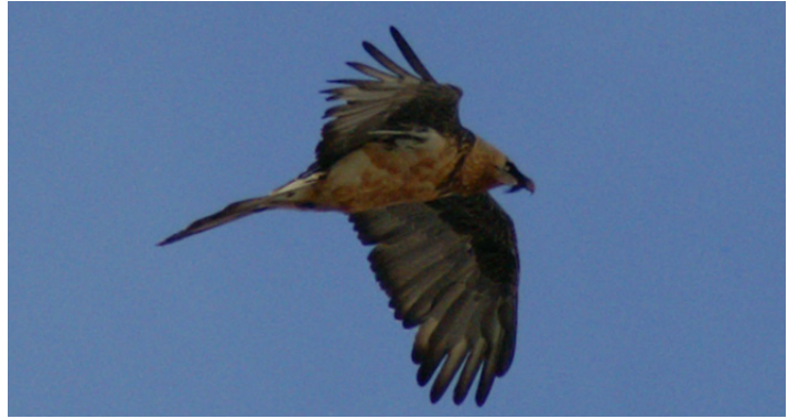
Gypaète barbu

Enfin, plusieurs oiseaux non nicheurs dans le Loiret ont été signalés, de passage dans notre département. Cela peut être des oiseaux en migration comme le Merle à plastron ( Turdus torquatus ) ou des individus erratiques, à l'image de l' observation exceptionnelle d'un Gypaète barbu ( Gypaetus barbatus ) au-dessus de Guilly, première observation pour le Loiret que l'on doit à notre ornithologue, recordman de la saisie de données, Pascal D. 😊 !