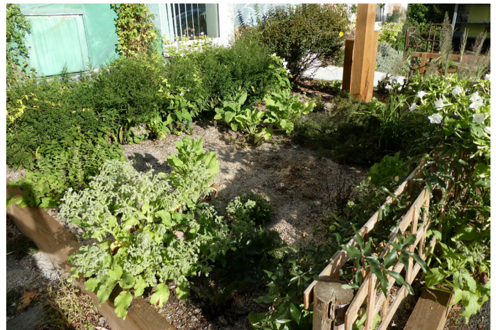
Jardin sec de la MNE

Pour montrer l'exemple, l'entrée de la Maison de la Nature et de l'Environnement a connu un réaménagement profitable avec la réalisation par un paysagiste (François Salle, de C3PO) d'un massif essentiellement composé de plantes aromatiques et sauvages.