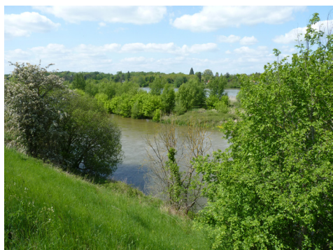
Point photo n°14-2010