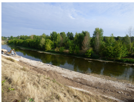
Point photo n°14-2015