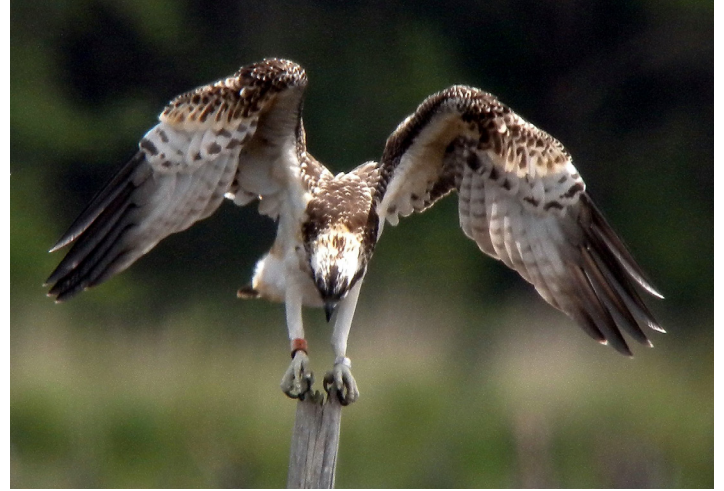
Jeune ADI au Ravoir le 4 juillet 2023

Heureusement, le deuxième jeune a pu évoluer sans encombre jusqu'à son émancipation qu'il a dû acquérir peu après le 5 août, date à laquelle il a été observé pour la dernière fois sur l'étang.