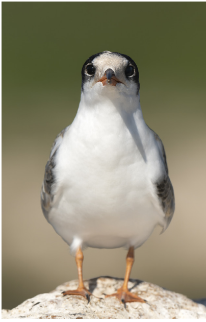
Sterne Pierregarin juvénile

Le bilan de la reproduction (en nombre de couples installés) s'élève donc à 198 couples de sternes pierregarins et 132 couples de sternes naines.