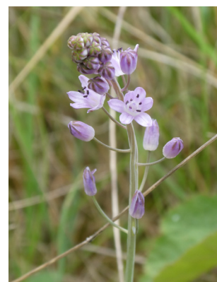
Scille d'automne

La Scille d'automne ( Prospero autumnale ) est une plante protégée en région Centre, qui se développe sur les prairies sableuses de bord de Loire. Une station de quelques pieds (moins de 5 !) était observée chaque année