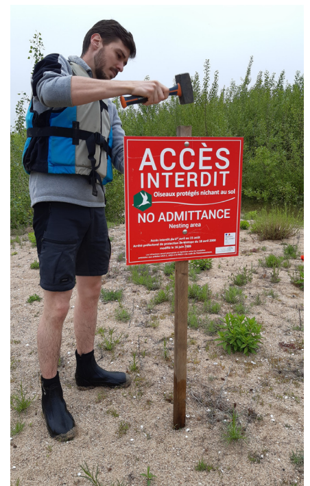
Installation panneau APB îlot C Mareau

Ce travail de réflexion est en cours et LNE participe activement aux réunions. Par ailleurs, notre association poursuit son partenariat avec la DDT et est invitée à venir contrôler, avant chaque intervention d'engins dans le lit mineur, que les travaux n'aient pas d'impact négatif sur la faune et la flore. Les gros travaux de gestion se déroulent généralement à l'automne ou à la fin de l'hiver.