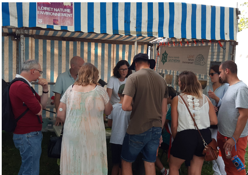
Stand à la fête du pont à Meung-sur-Loire

Enfin, les 21 et 22 octobre, la commune de Mareau-aux-Prés organise sa 20e Fête des Plantes et de la biodiversité . L'équipe de la réserve naturelle tiendra un stand et proposera des animations autour de la faune de la Loire. Ce sera aussi l'occasion de valoriser le partenariat avec la commune, qui a confié à notre association la gestion écologique de certaines de ses parcelles.