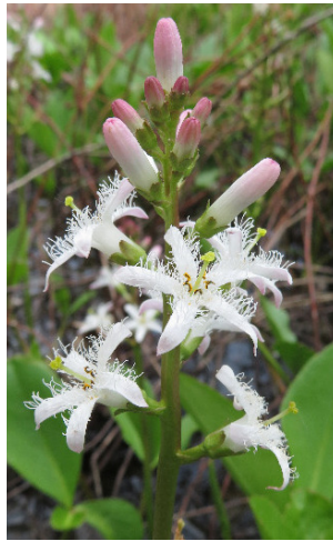
Trèfle d'eau © E. Vileski

Plus de 1500 espèces ont été saisies en 2023 pour presque 41 000 données supplémentaires. Parmi elles, plusieurs sont assez remarquables par leur rareté ou leur difficulté d'observation. On peut notamment citer le Sympétrum vulgaire ( Sympetrum vulgatum ), libellule en danger critique d'extinction en région, dont la dernière observation remonte à 2020 dans le Loiret ; le Genêt d'Allemagne ( Genista germanica ), également en danger critique d'extinction dans le Centre-Val de Loire, arbuste des landes humides, à rechercher dans la Forêt d'Orléans, ou encore le Trèfle d'eau ( Menyanthes trifoliata ) à l'ouest du Loiret dont les populations beauceronnes ont quasi disparu.