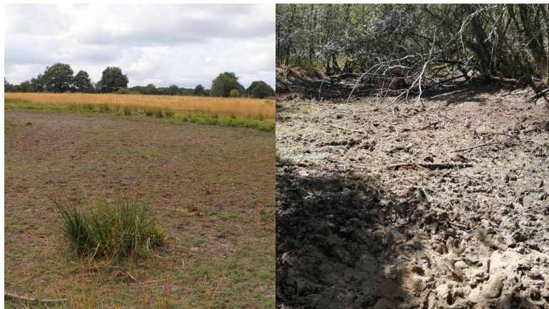
Mares asséchées en Sologne