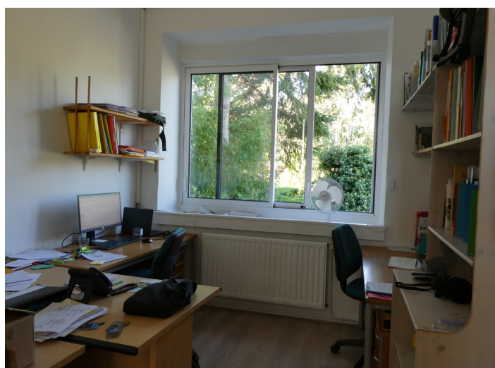
Bureau de la réserve naturelle - Après travaux