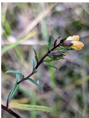
Odontite de Jaubert

C'est ainsi que l'année 2023 aura été faste pour l' Odontite de Jaubert ( Odontites jaubertianus ), espèce protégée au niveau national et classée vulnérable en région Centre-Val de Loire. Cette espèce des milieux secs est une des rare espèces endémiques des plaines françaises . Une