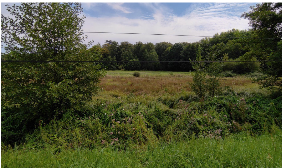
Une prairie humide dans le Pays Fort

De nouvelles recherches seront réalisées au printemps prochain, en espérant retrouver les anciennes stations connues de population de Cuivré des marais et même en découvrir de nouvelles.