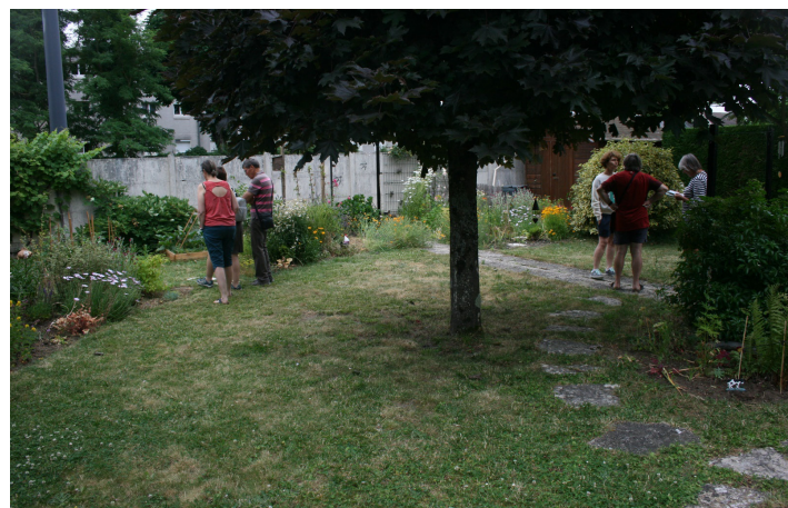
Jardin de Nathalie Berna à Saint-Jean-de-Braye