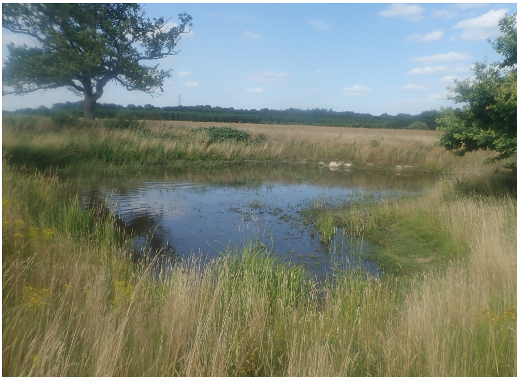
Mare où le Pélobate brun s'est reproduit en 2023