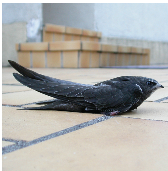
Martinet noir