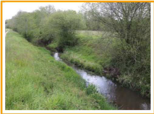
La Bergeresse

Située dans le quart sud-ouest du département du Loiret, à cheval sur le Val-de-Loire et la Sologne, c'est une commune verdoyante, traversée d'Est en Ouest par le Dhuy (qui porte le nom de Bergeresse au niveau de la commune), affluent du Loiret, qui sépare la zone agricole du Val-de-Loire (au nord) de la Sologne, zone forestière émaillée de très nombreux étangs, au sud.